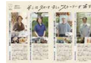
↑ 上越市 様 インタビュー・ライティング