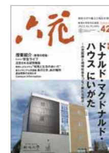
↑ 新潟大学 様 パンフレット