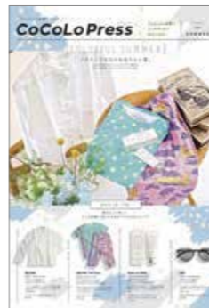
↑ CoCoLo長岡 様 折込チラシ