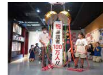
↑ 信濃川大河津資料館 来館者100万人達成 くす玉