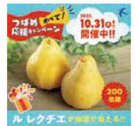
↑ 燕市農政課 様 SNS広告