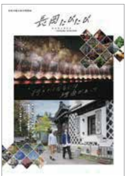
↑ 長岡市観光企画課 様 パンフレット