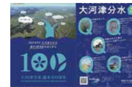
↑ 信濃川河川事務所 様 「クリアファイル」