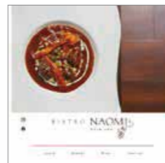
↑ BISTRO NAOMI 様 ホームページ