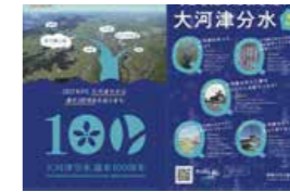
↑ 信濃川河川事務所 様 「クリアファイル」