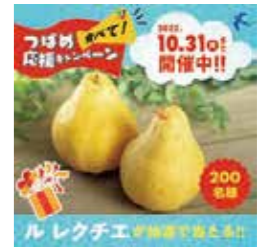
↑ 遠藤孝商店 様 SNS広告