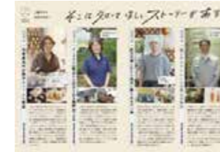
↑ 上越市 様 インタビュー・ライティング